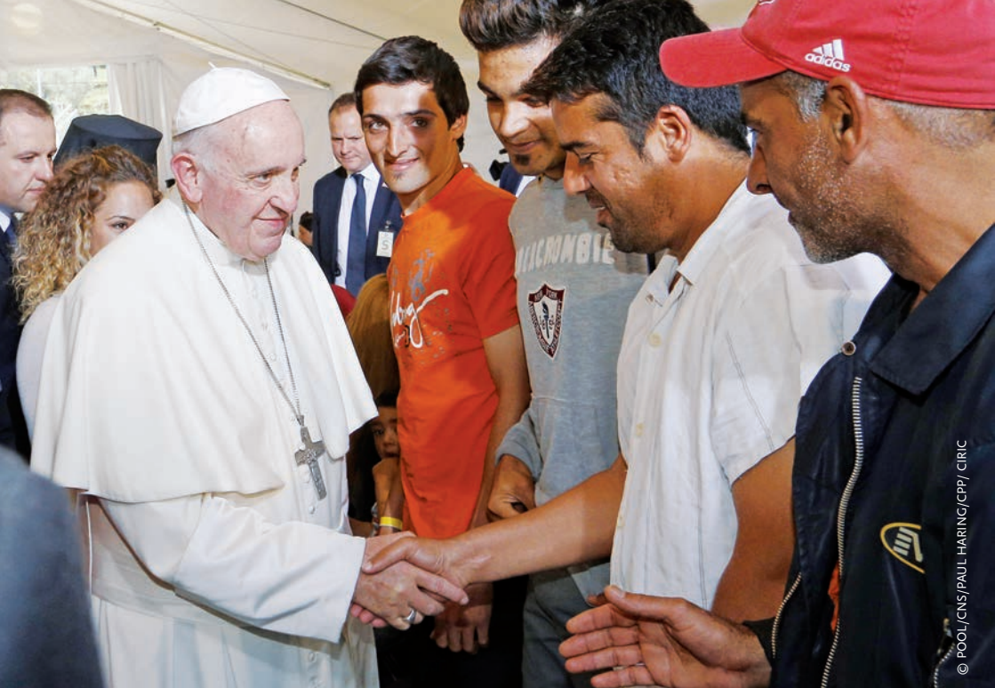
Le Pape visite un camp de réfugiés sur l'île de Lesbos (Grèce).

depuis le départ jusqu'au voyage, depuis l'arrivée jusqu'au retour. C'est une grande responsabilité que l'Église entend partager avec tous les croyants ainsi qu'avec tous les hommes et femmes de bonne volonté, qui sont appelés à répondre aux nombreux défis posés par les migrations contemporaines, avec générosité, rapidité, sagesse et clairvoyance, chacun selon ses propres possibilités.