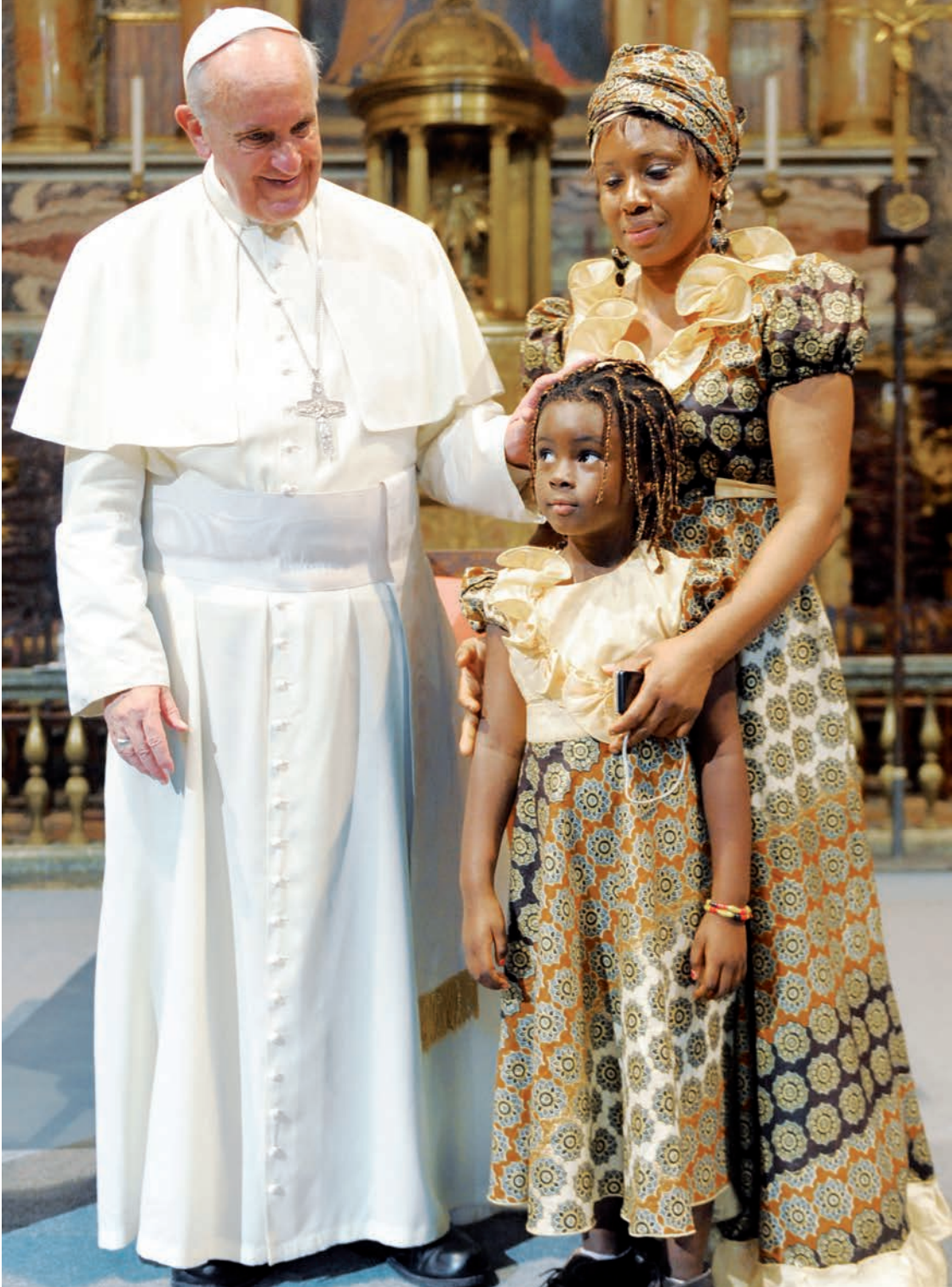
Le Pape rencontre une mère et sa fille, réfugiées, après une visite au centre d'accueil jésuite Astalli, à Rome.