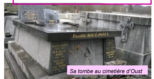
Sa tombe au cimetière d'Oust

« Nous l'avions rencontré sur notre route dès les premiers pas de sa vie religieuse et déjà nous reconnaissons en lui un compagnon de Jésus, soucieux de vivre le style ignacien des projets audacieux, des amples désirs apostoliques. A l'intérieur d'horizons trop étroits, il étouffait. La terre entière était seule la mesure de son ambition sacerdotale. Dès sa jeunesse religieuse, il était poursuivi par la hantise de la parcourir, de la pétrir, de la convertir. Le Seigneur a répondu en partie à ses aspirations...»