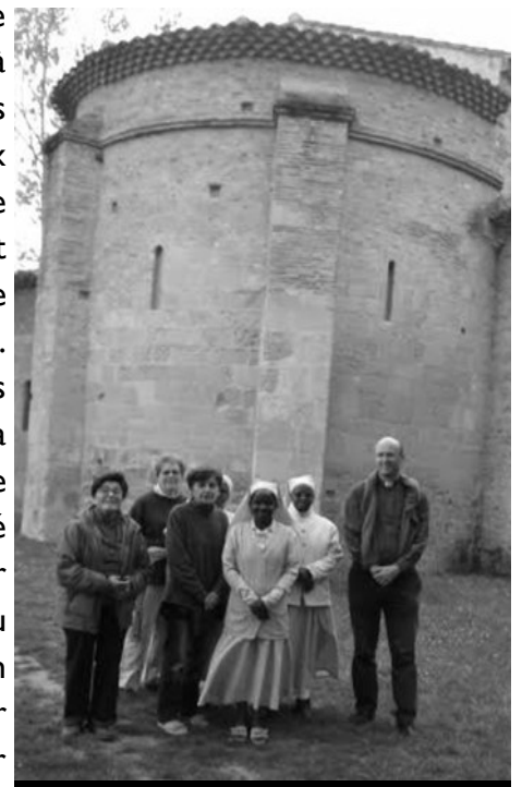
Les catéchistes en sortie à Pamiers, à l'église de Cailloup.