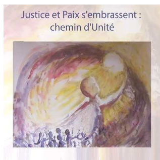
Justice et Paix s'embrassent : chemin d'Unité

« Justice et paix s'embrassent : chemin d'unité »