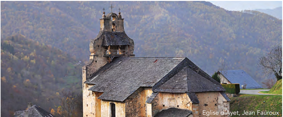
Eglise d'Ayet, Jean Fauroux