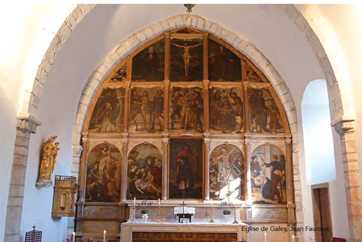
Eglise de Galey, Jean Fauroux