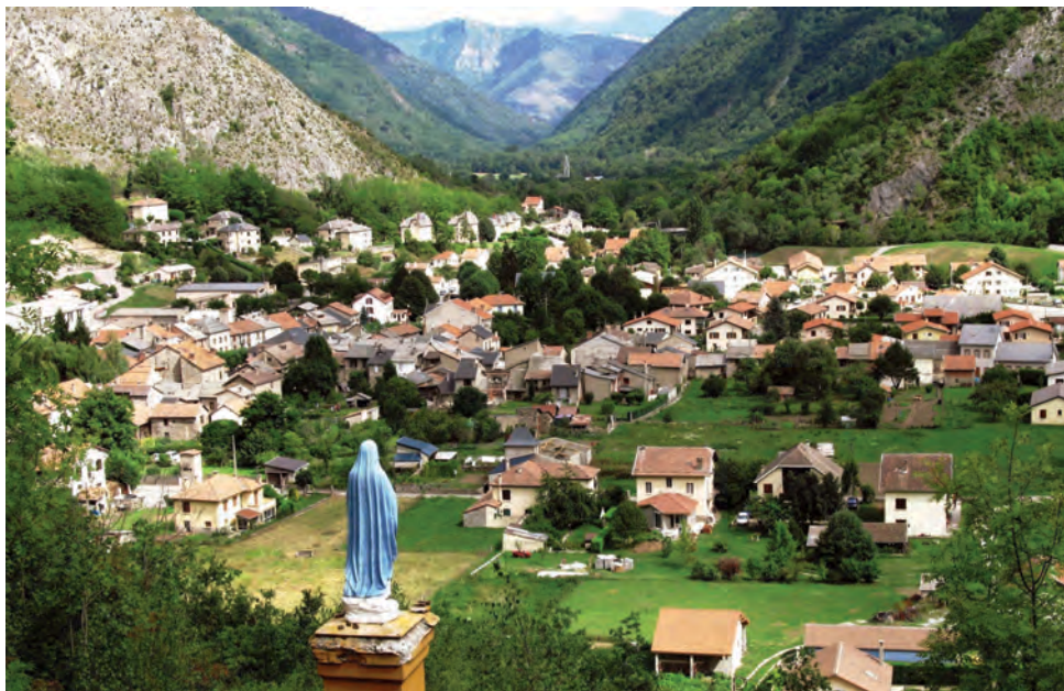
Vierge d'Auzat, Joseph Cassu

Cette charte qui vous est proposée est comme la prolongation de ce que nous avons exprimé ensemble au cours du rassemblement diocésain du 6 avril 2019.